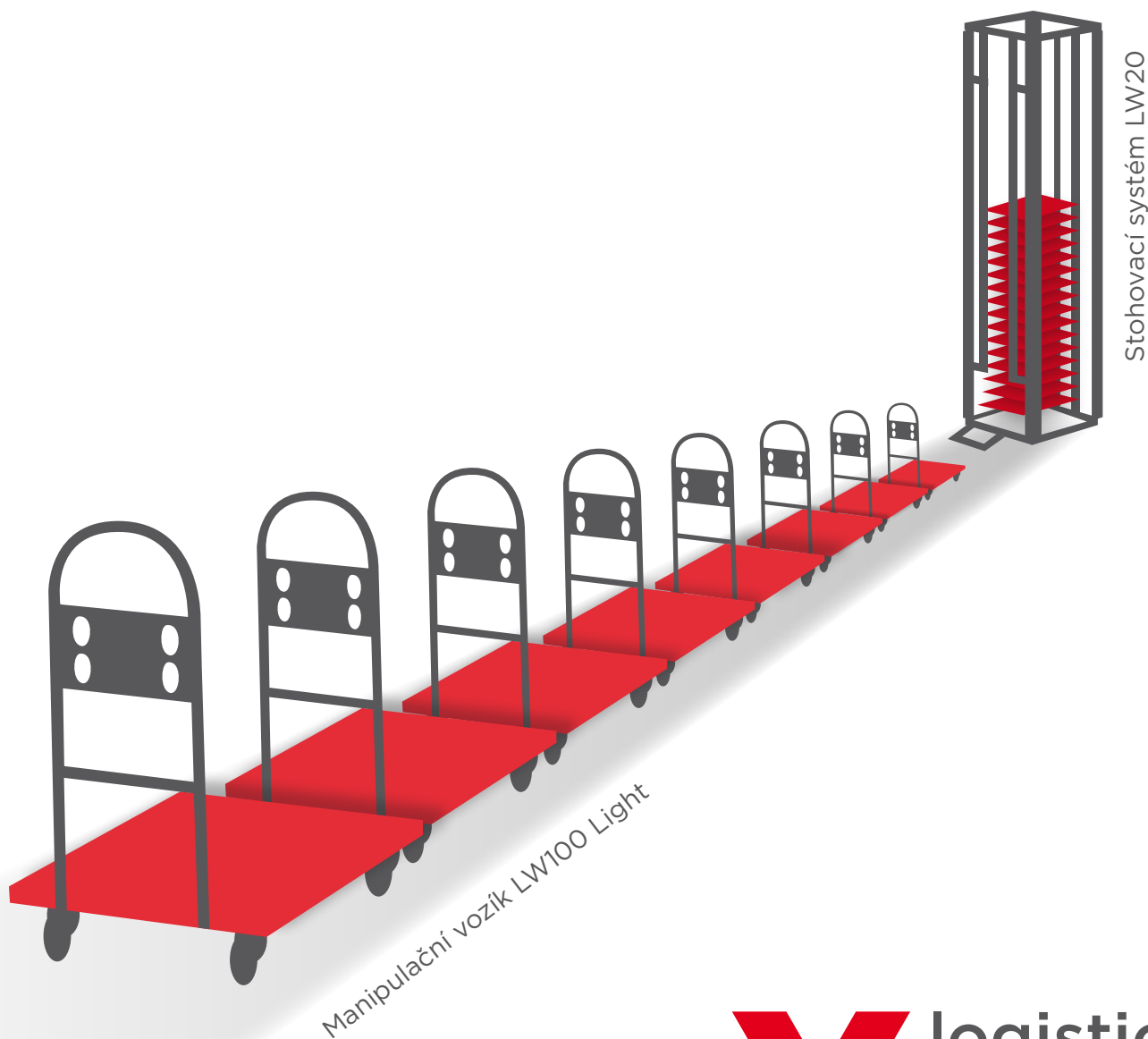
Manipulační vozík LW100 Light